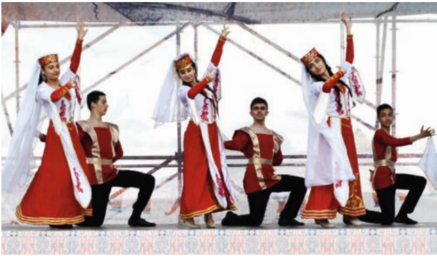
Էլ ինչ համերգ առանց «Ճալխոյի»: