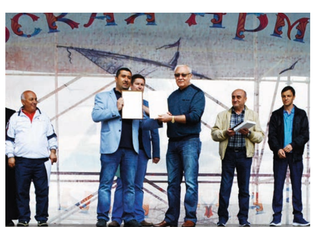
Պատվոգրեր ենք ստահնում ու հահնճնում: