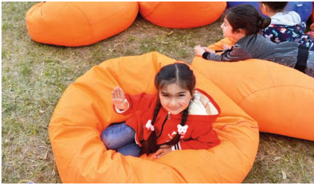
Լավ էլ փափուկ տեղ ենք գտել...