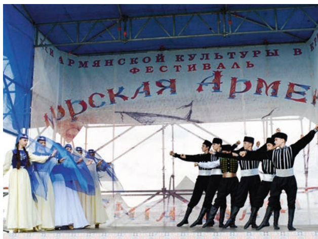
Ղրիմի թաթարներն էլ պարեցին մեզ համար...