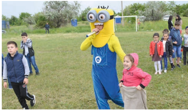
Փոքրիկների սիրած Մինյոններն էլ են Հայկավանում: