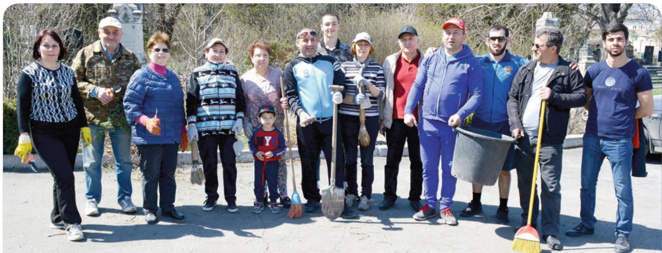
Дружная команда участников субботника (конечно, это не все).