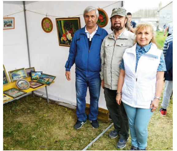
Մեր նկարհիչների փոքրիկ ցուցահահանդեսը: