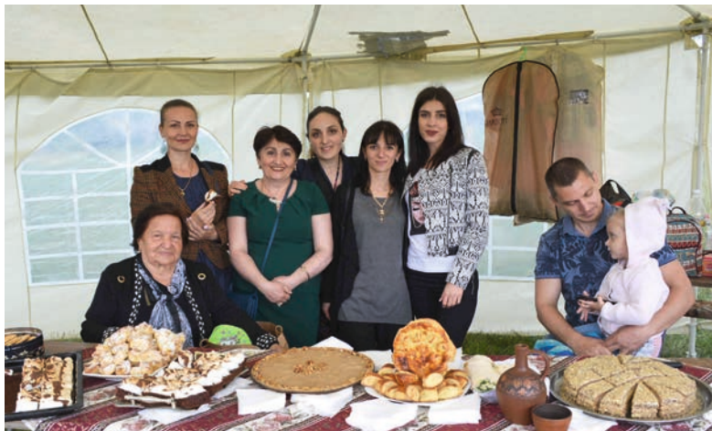
«Արարատի» մայրիկներն ու տատիկներն իրենց վարպետությունն են ցուցադրում տնական հալվալով ու գաթալով:

Состоялись также показательные выступления школ спортивных единоборств, благотворительный аукцион, который с юмором провёл ведущий концерта Спартак Ян. Самые малень-