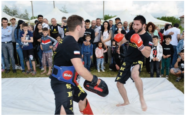
Քիբ-բոքսինգն էլ է բոլորին հետաքրքիր: