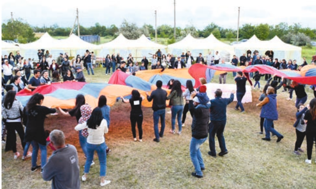
Ահա և ամենամեծ եռագույնը երիտասարդների ձեռքում: