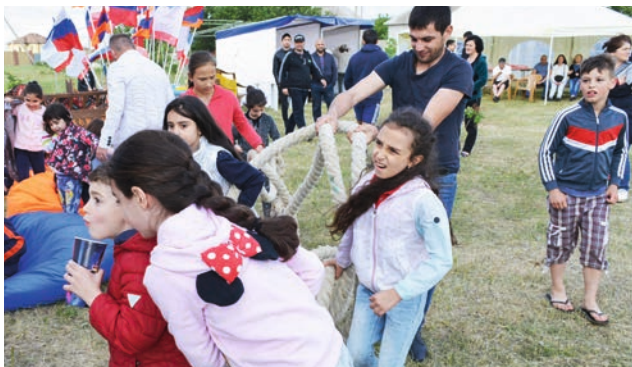
Փոքրիկներին ամեն ինչ հետաքրքիր է: