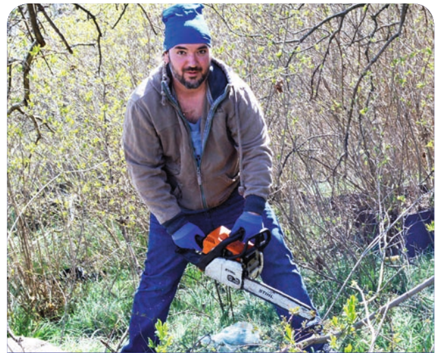
Тимур предпочёл использовать более серьёзную технику, чем простой секатор и топор.