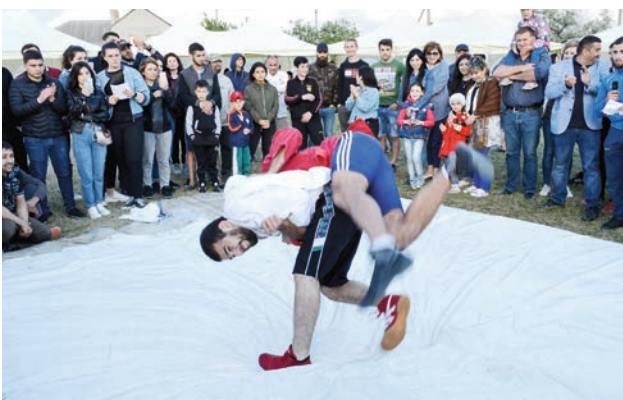
Հաջողված հնարք, և ախոյանը հայտնվում է գորգի վրա: