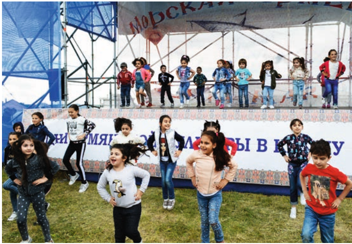
Մե՛կ, երկո՛ւ, երե՛ք, չո՛րս... Սրահնից էլ ուրախ պահր: