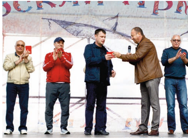
Հուշամեդալ Տրուդոլոյեի գյուղխորհրդի նախագահին: