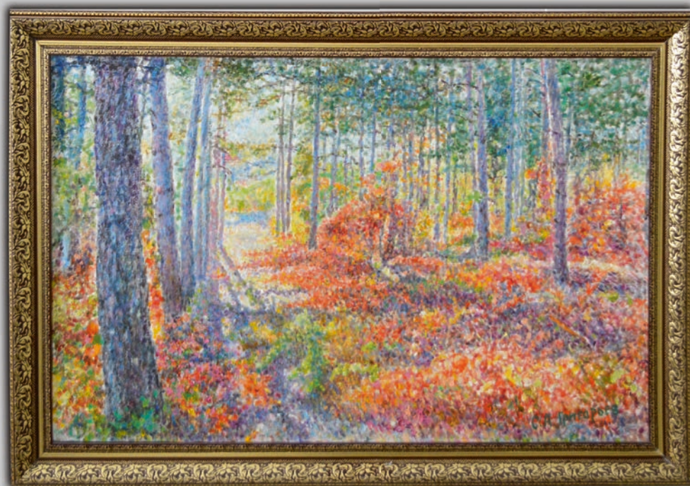
Մարգարիտ Սարգիսյան Գոթական անտառ 2019 թ. 11.12

Картины армянских художников с юбилейной выставки.