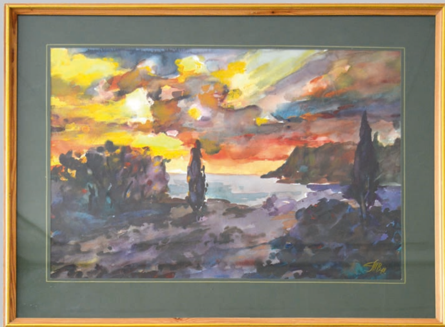
Մարգարիտ Սարգիսյան Սև ծովի լույսը 2019 թ. 11.12