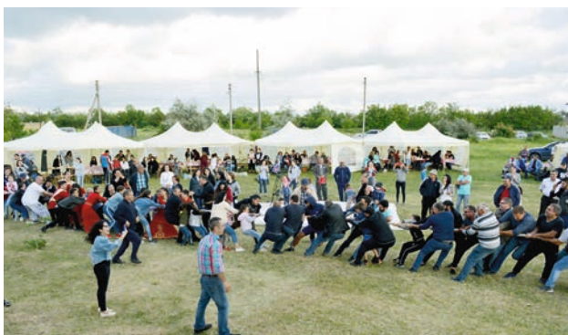
Քաշիր, հա քաշիր... Հայկականցիներին հարազատ դաշտն էլ է օգնում: