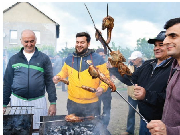
Դե հիմա տեսնենք, թե ում խորովածն է ամենալավը:

В разгар празднования юноши и девушки сошлись в хороводе. К их зажигательному танцу