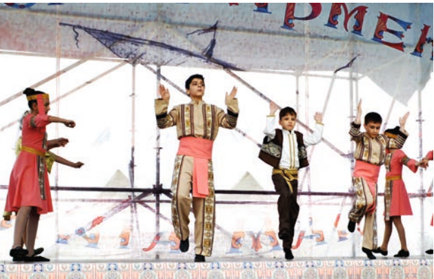
«Արարատի» միջին խումբն արդեն բավականին լավ է պարում: