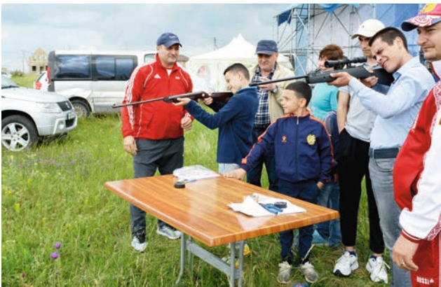
Հրաձգության վարպետության դասեր է տալիս օլիմպիական չեմպիոն Արթուր Այվազյանը: