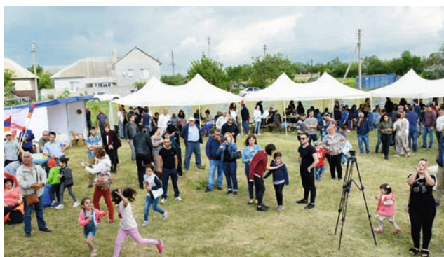
Աշխուժությունն ամեն տեղ է: