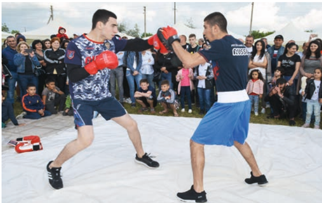
Իսկ ո՞վ բռնցքամարտ չի սիրում...