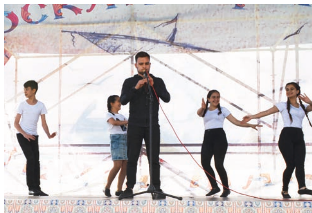
Առանց դուդուկի էլ հայկական համերգ չկա: