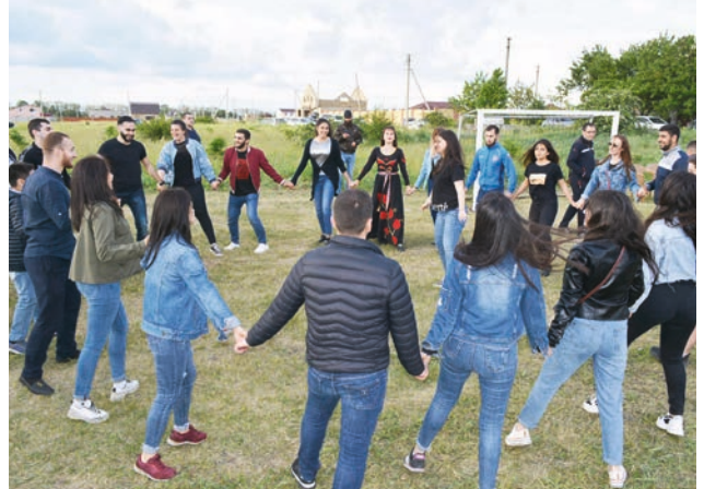
Սա էլ մեր ավանդական «Քոչարին»: