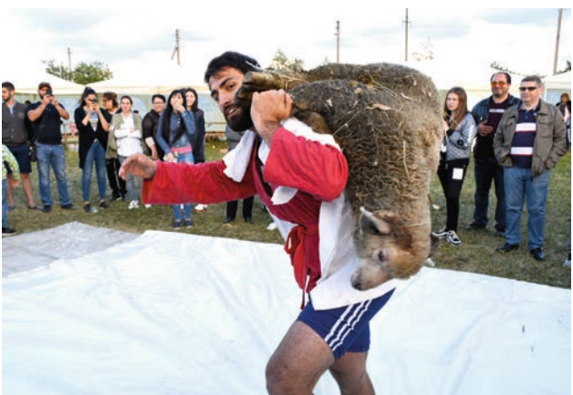
Մրցանակը շատ ծանր է, բայց և պատվավոր ու քաղցր, ինչպես փառքը...