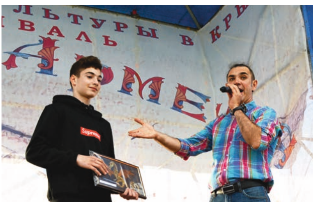
Անուրդում խաղարկված առաջին լուրը վաճառված է: