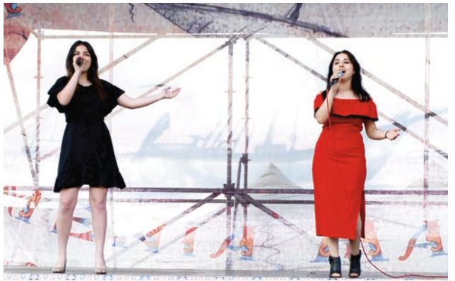
Լեռնուհին ու Նելլին ընկերուհիներ են կյանքում ու միասին էլ թե՛ են դուրս գալիս: