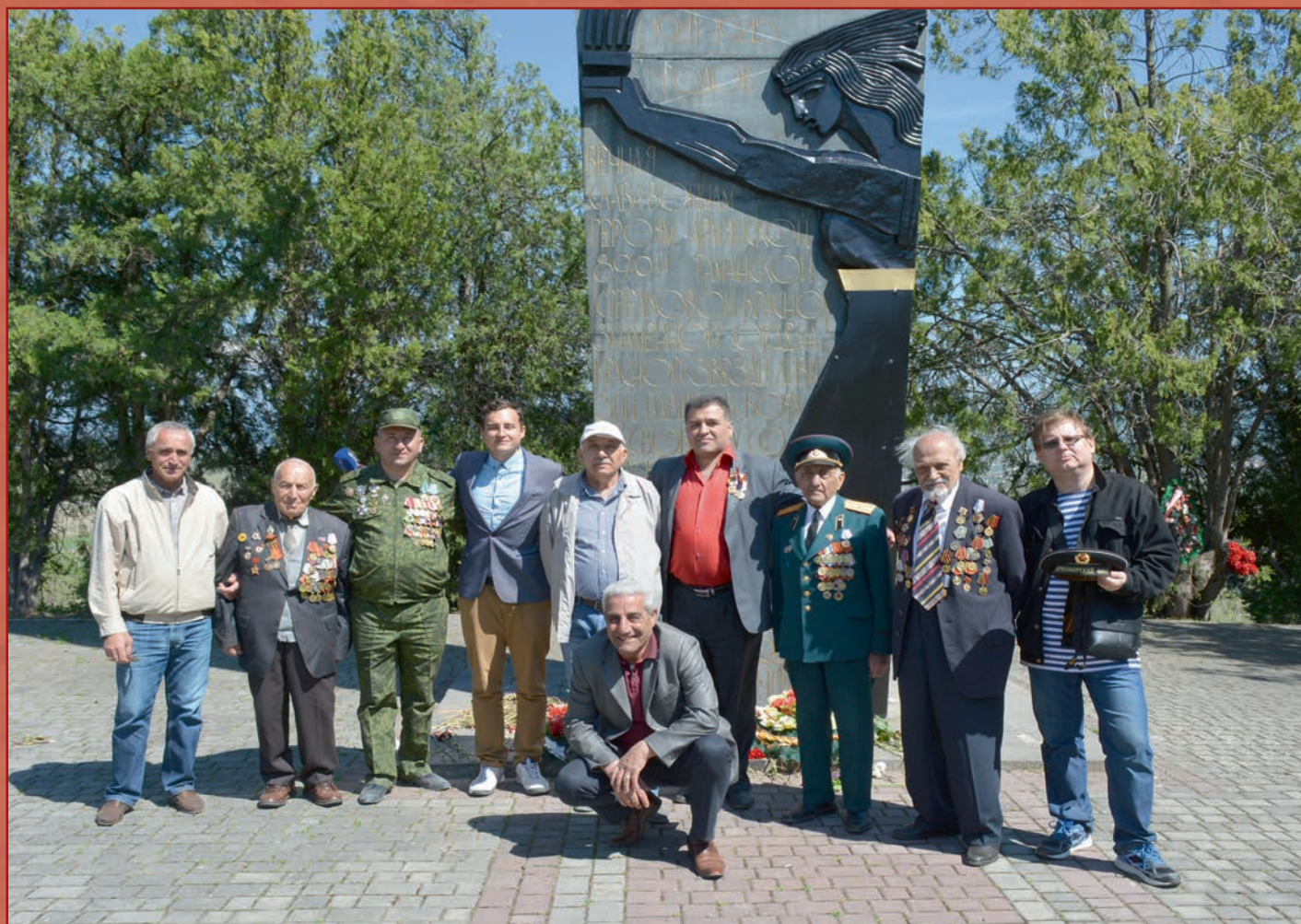
У памятника воинам 89-й Таманской армянской стрелковой дивизии под Севастополем.

Проект поддержан Государственным комитетом по делам межнациональных отношений и депортированных граждан Республики Крым и Государственным автономным учреждением Республики Крым «Медиацентр им. Исмаила Гаспринского».