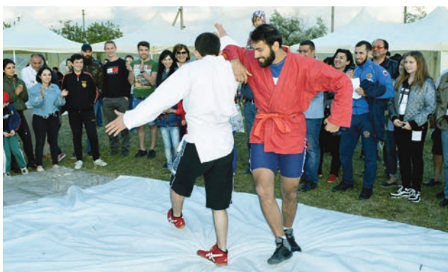
Հայկական պարը կոխ ըմբշամարտի անբաժանելի մասն է: