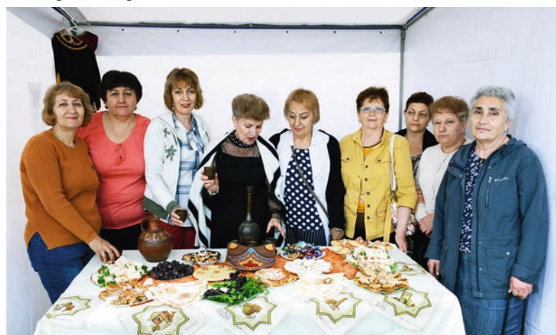
«Մայրիկ» լիզան, ինչպես միշտ, առաջին շարքերում է:

кие участники торжества весело провели время в компании аниматоров.