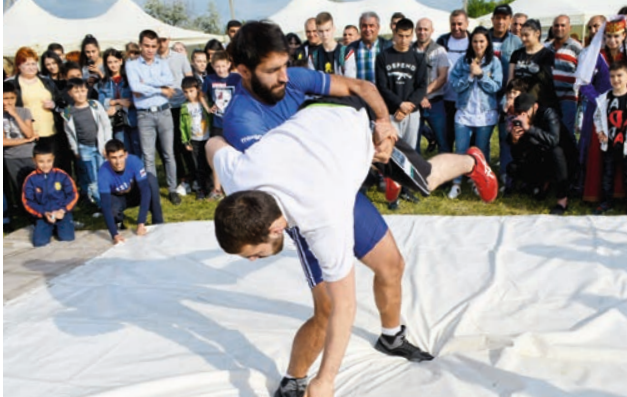
Հունահռոմեական ըմբշամարտի ցուցադրական ելույթները: