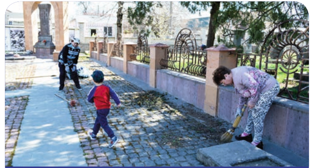
Лига «Майрик» отвечает за чистоту и порядок вокруг памятника 100-летию Геноцида.

К сожалению, немногие наши соотечественники участвовали в этом богоугодном деле, но те, что пришли в этот день, работали не покладая рук под палящим солнцем. Двор церкви, памятник 100-летию Геноцида, аллея, ведущая к воин-