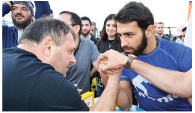
Արմենստլինգի մրցույթում Ռ-աֆայելին դժվար է հաղթել: