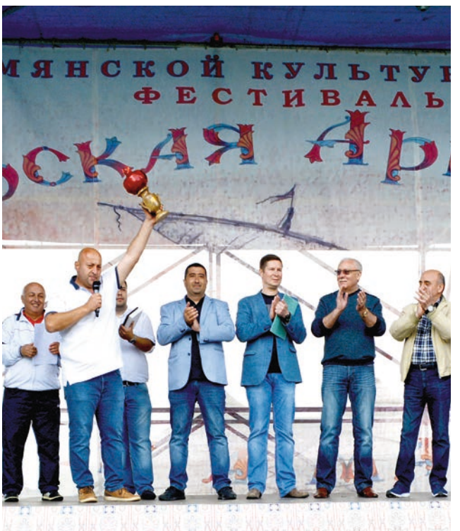
Ֆուտբոլի մրցահչարում հաղթեց Մևահտոտյալի թիմը Մերոպ Հակոբյահնի գլխավորոլթյահմբ: