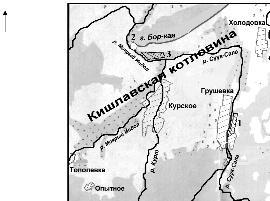
Рис. 1. Карта-схема Кишлавской котловины со средневековыми памятниками, описанными в статье: 1 – поселение Сала; 2 – пещерная церковь на западном склоне г. Бор-Кая; 3 - средневековое поселение на припойменной террасе р. Мокрого Индола. М 1:500 м.