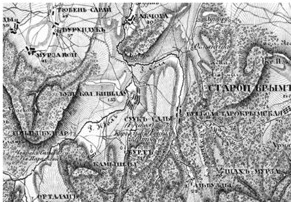
Рис. 2. Топографическая карта Кишлавской котловины XIX в. Съемка полковника Бетева и подполковника Оберга. М 1дюйм – 1 верста.