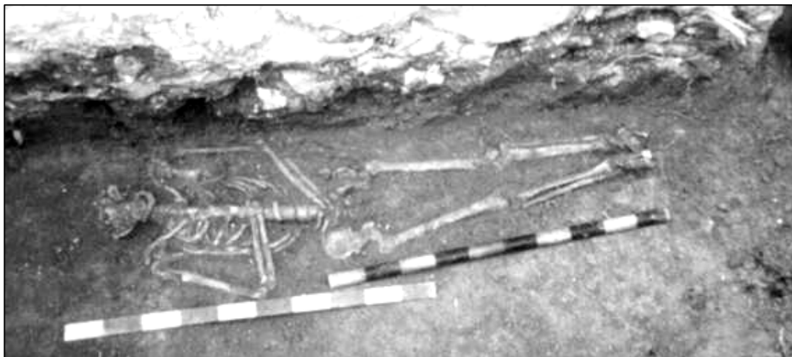
Рис. 6. Храм в с. Грушевка. Позднесредневековое грунтовое погребение, открытое на уровне фундамента стены южного придела церкви.