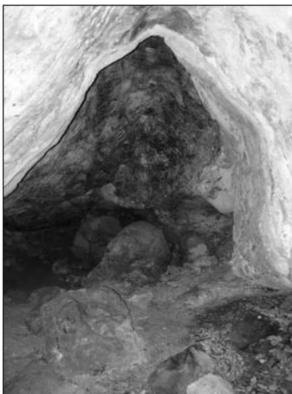
Рис. 12. Интерьер пещерной церкви на г. Бор-Кая. Вид с запада.