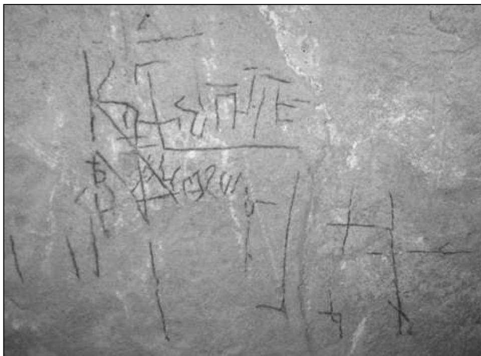
Рис. 13. Пещерная церковь на западном склоне г. Бор-Кая. Надпись на скальном своде храма.