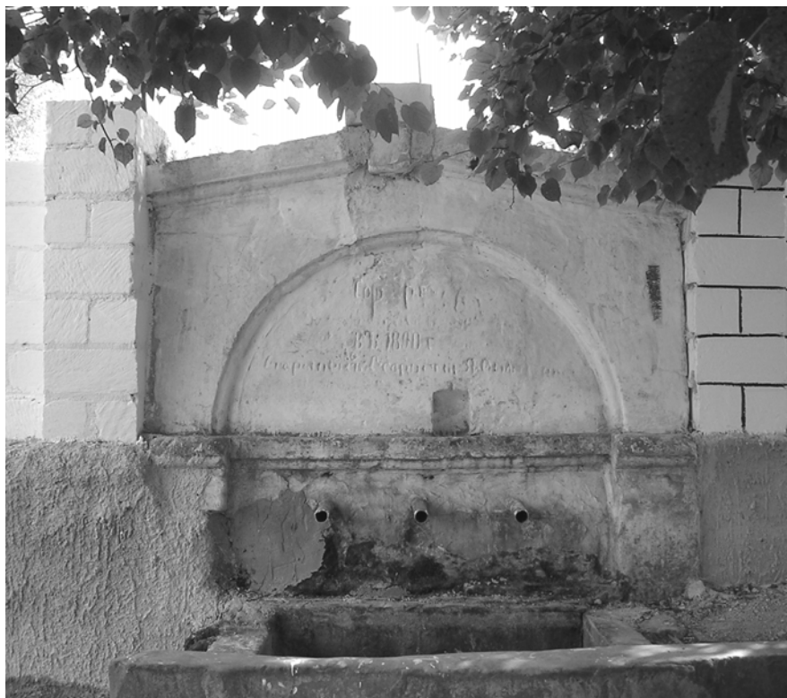
Рис. 9. Грушевка. Сельский фонтан.