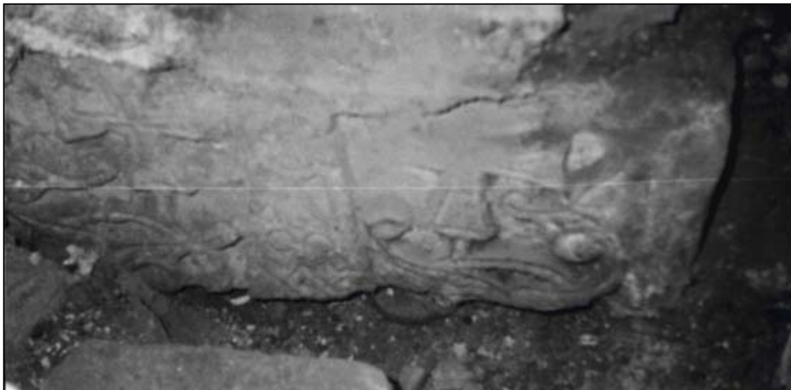
Рис. 5. Храм в с. Грушевка. Фрагмент хачкара из фундамента юго-восточного пилона церкви.