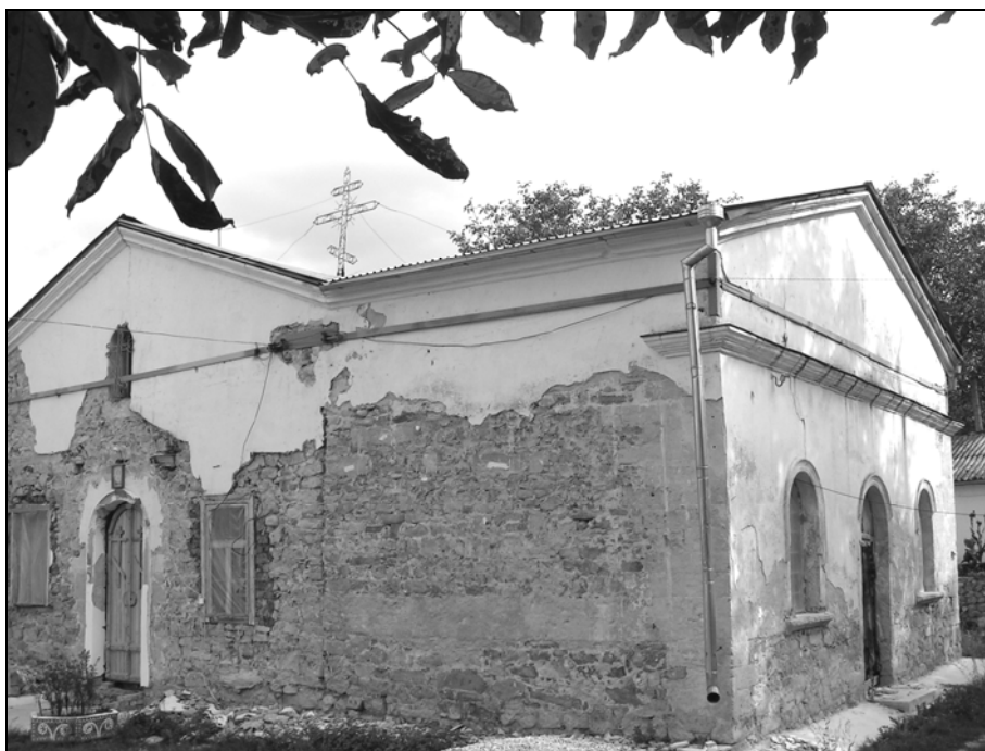
Рис.3. Храм в с. Грушевка. Вид с юго-запада.