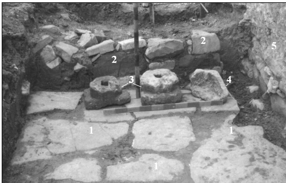
Рис.7. Храм в с. Грушевка. Строительные остатки XVI-XVIII вв. и архитектурные детали, открытые к западу от церкви: 1 - вымостка пола помещения; 2 – бутовая кладка; 3 – база под колонну; 4. – фронт корыта; 5 – западная стена церкви.