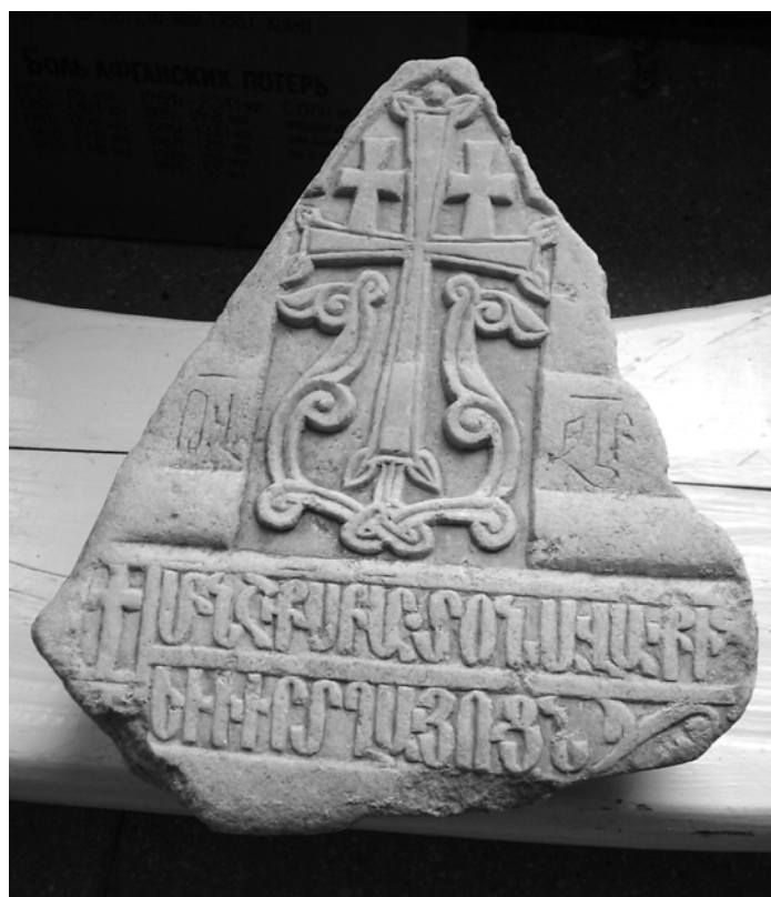
Рис.10. Хачкар 1483 г. из экспозиции музея средней школы в с. Грушевка.