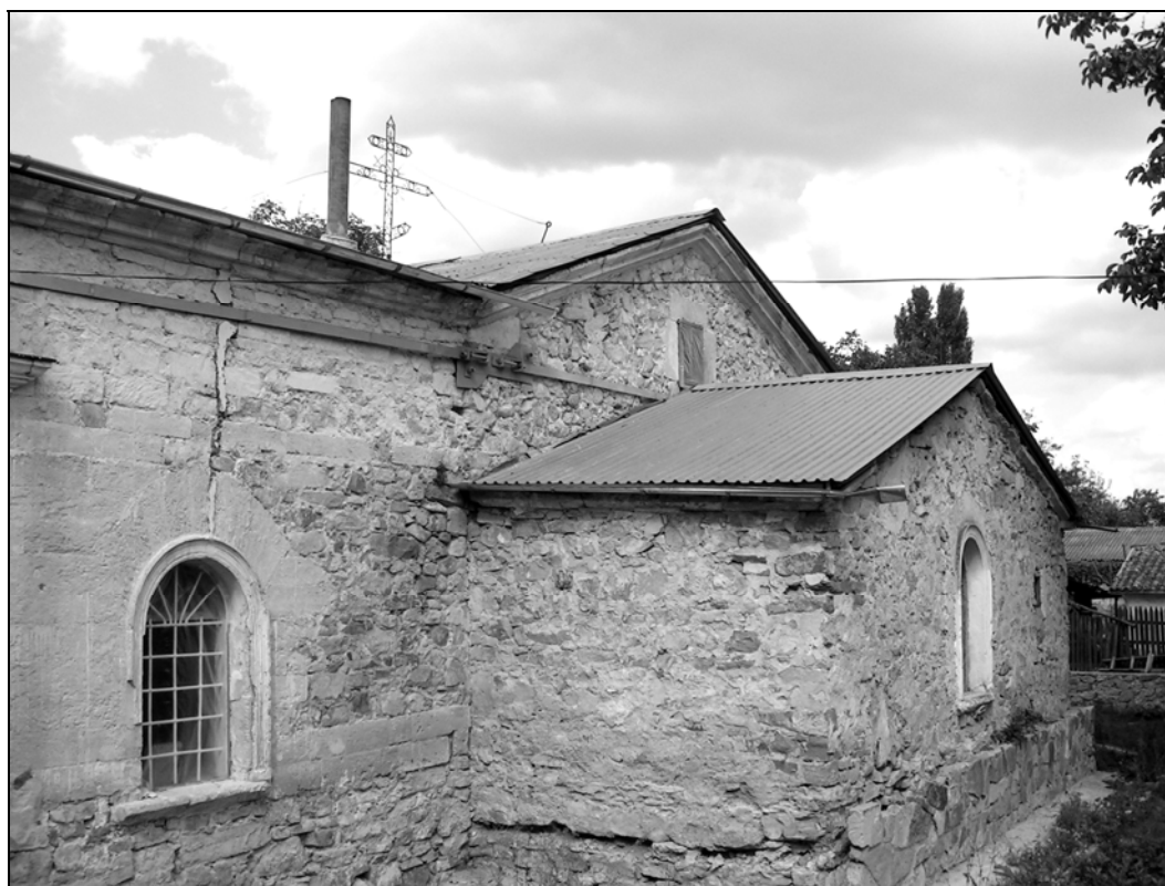
Рис. 4. Храм в с. Грушевка. Вид на алтарную часть с юго-востока.