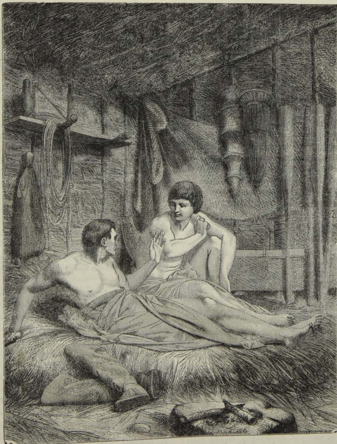
Ձկնորսը կամ Աղքատուքին.

հանգստութիւնը կուգայ եւ գիրենք կարթնցընէ : եղէզնապատ խրճիթի մը մէջ երկու ծեր