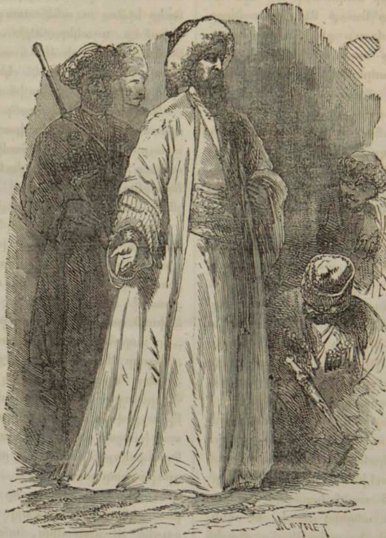
Իմամ եւ մարիտը.

Շամիլ լեռնական ազգերուն Լեզլի քուած ցեղէն ծնած է 1799-ի՛ Տաղստանի Կոււրի ա-