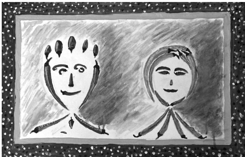
«Сладкая парочка»: портрет, составленный из горьких перцев. Холст, акрил.

А когда мы вдвоём хулиганимся, Как с невестой жених объясняемся, Когда шутками мы обгоняемся, Есть гарантия – мы не состаримся.